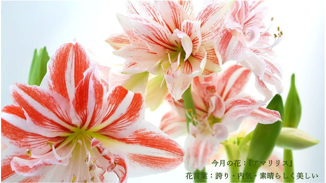
今月の花：「アマリリス」

ルームフォー新聞/アマリリス便り 2021年(令和3年)5月号 フリーダイヤル0120-19-6640 第43号 1/2